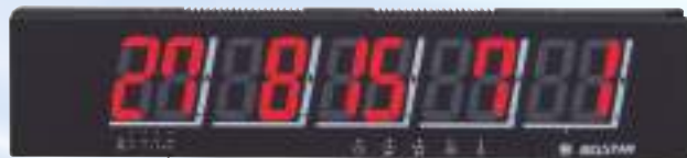
BS5R:受信表示機 BS5RS:特殊受信表示機(親機) BS5J:表示専用子機(子機)