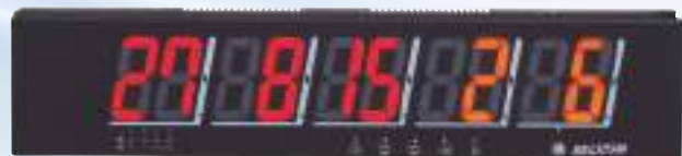
BS5RRS:RC表示可特殊受信表示機(親機) ※両面BS5RMもあります BS5JR:RC表示可専用子機(子機) ※両面BS5JMもあります

※RC番号がない時、4枠目5枠目も卓上番号(赤)表示になります ※LAN機能付きのBS5RRS-LANもあります