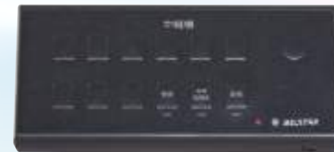
BSLINK ★送信機の電波を中継します