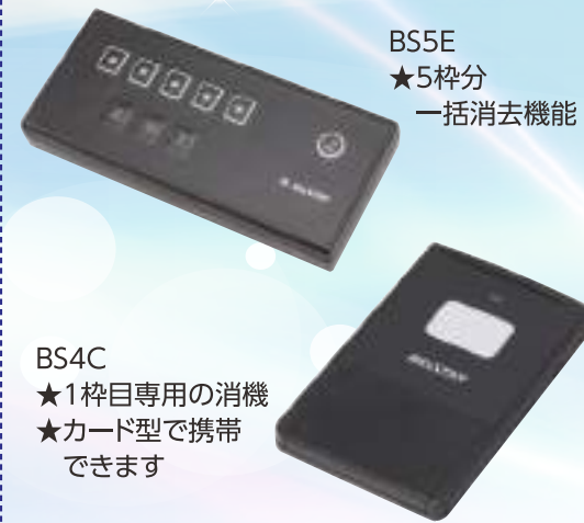
BS5E ★5枠分一括消去機能