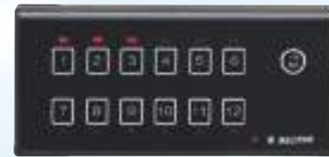
BS512:RC送受信機 ★軽量・小型 ★簡易12枠受信機に切替可(送信機12台まで対応)

※RC番号がない時、4枠目5枠目も卓上番号(赤)表示になります ※LAN機能付きのBS5RRS-LANもあります