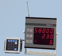
無線タイプ(特定小電力無線) 21UDS-3-429