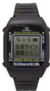
腕時計型受信器 [SWSR-2125] 定価¥48,000