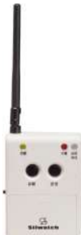
送受信器 [SWSR-P125] 定価¥45,000